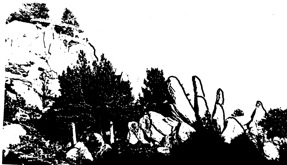
le rocher de la Trinité